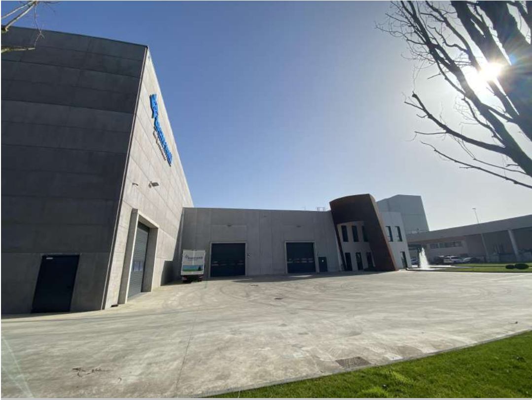
POSIZIONE DI SCATTO 10