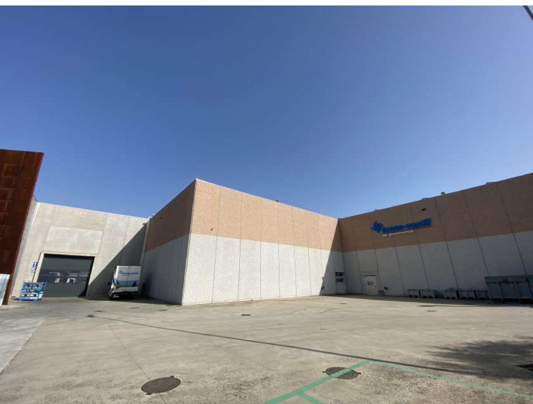
POSIZIONE DI SCATTO 17