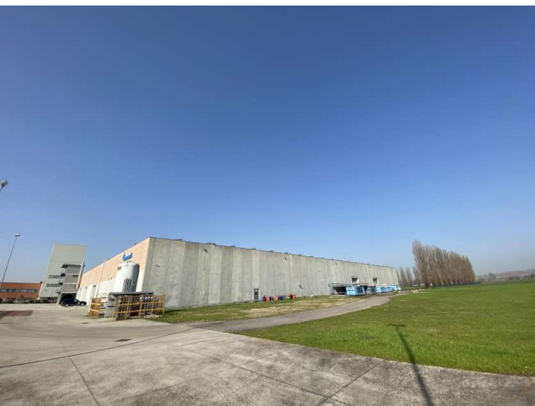
POSIZIONE DI SCATTO 23