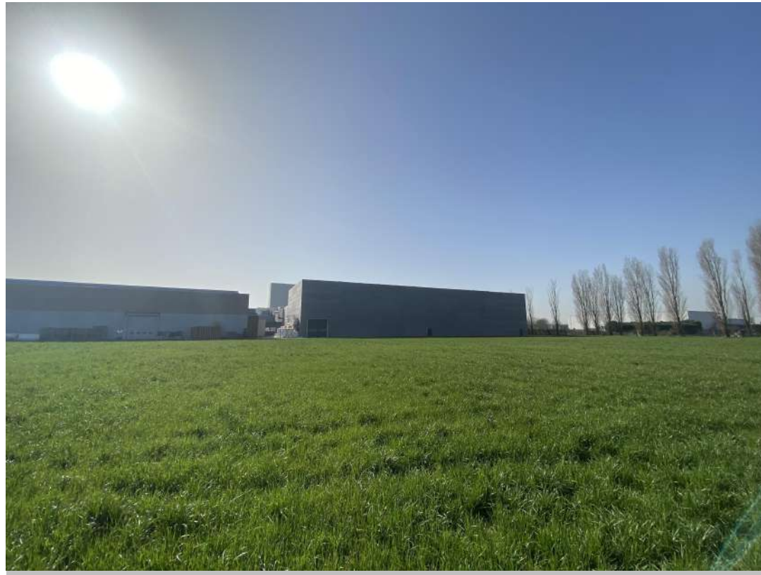
POSIZIONE DI SCATTO 2