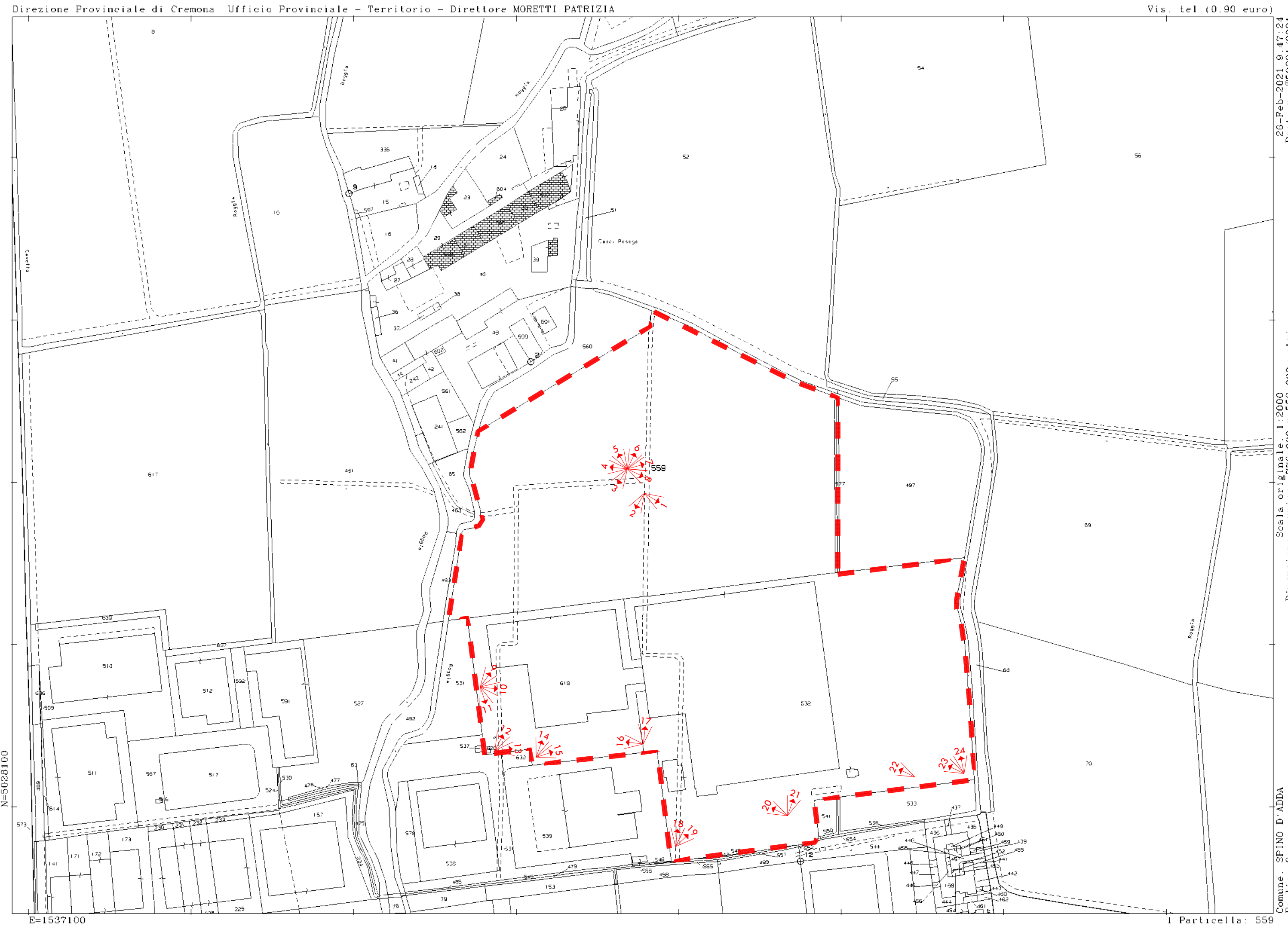
ESTRATTO DI MAPPA CON EVIDENZIATE LE POSIZIONI DI SCATTO