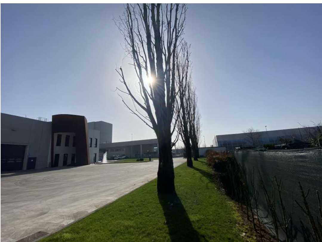
POSIZIONE DI SCATTO 11