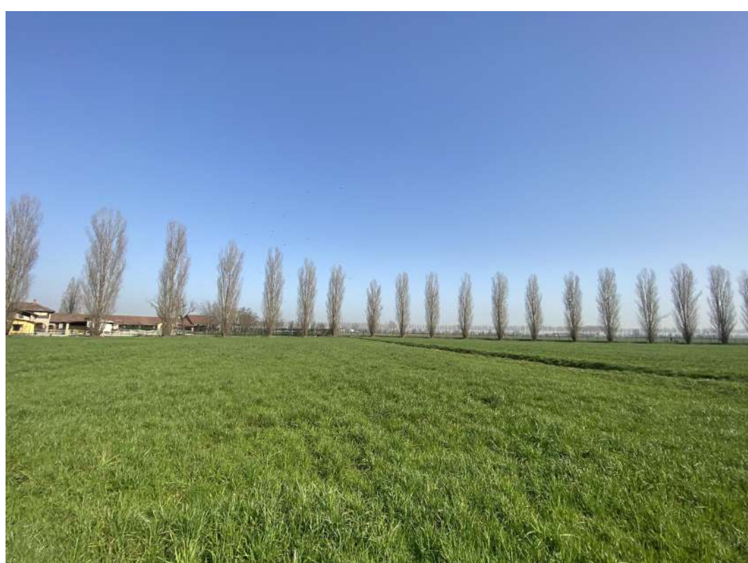
POSIZIONE DI SCATTO 6