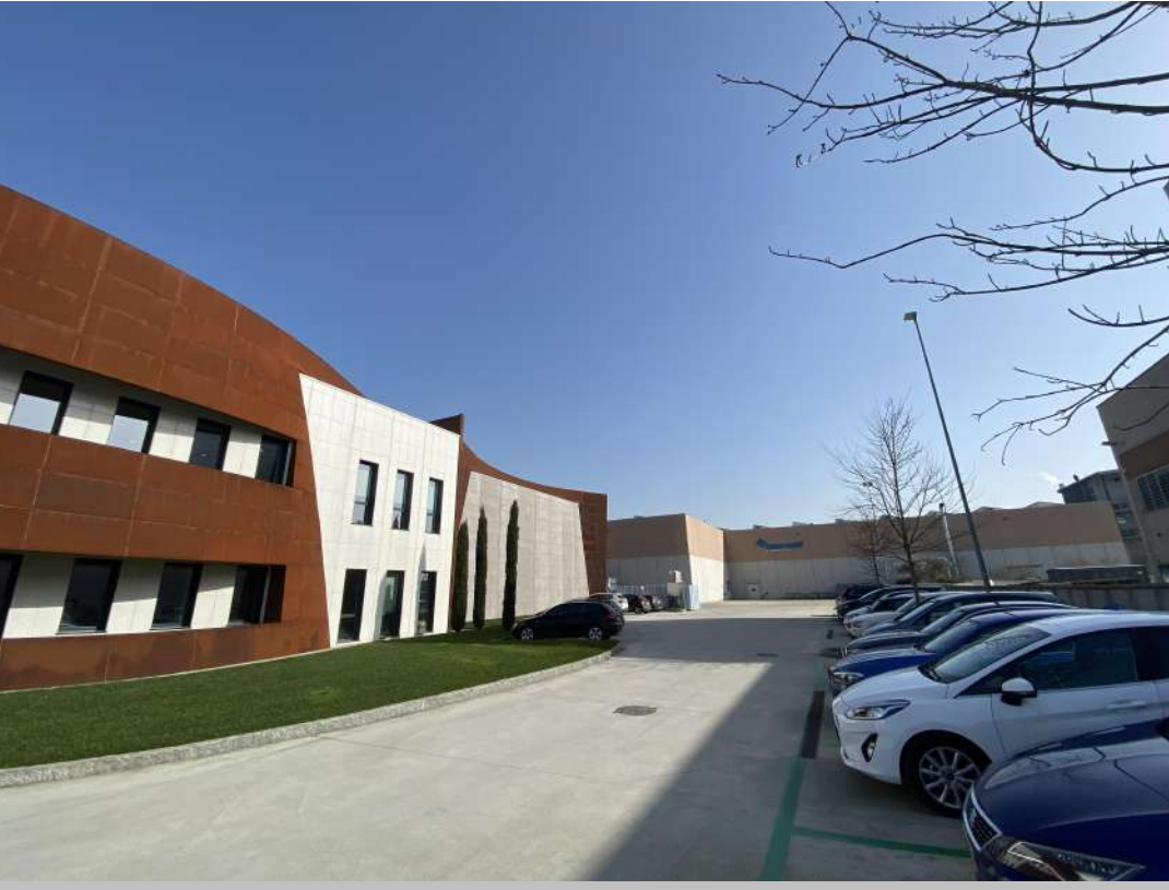
POSIZIONE DI SCATTO 15