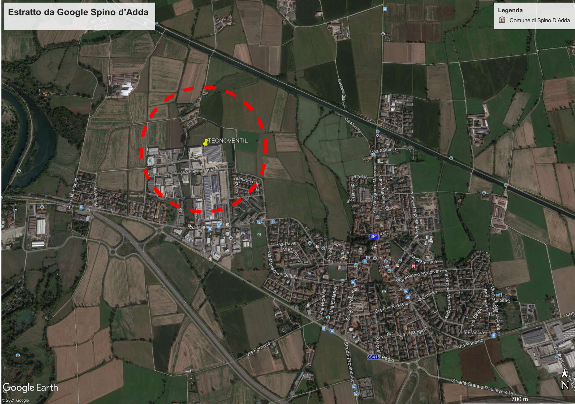
ESTRATTO DA GOOGLE SPINO D'ADDA