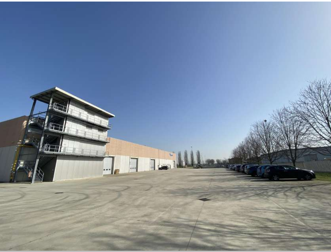
POSIZIONE DI SCATTO 19