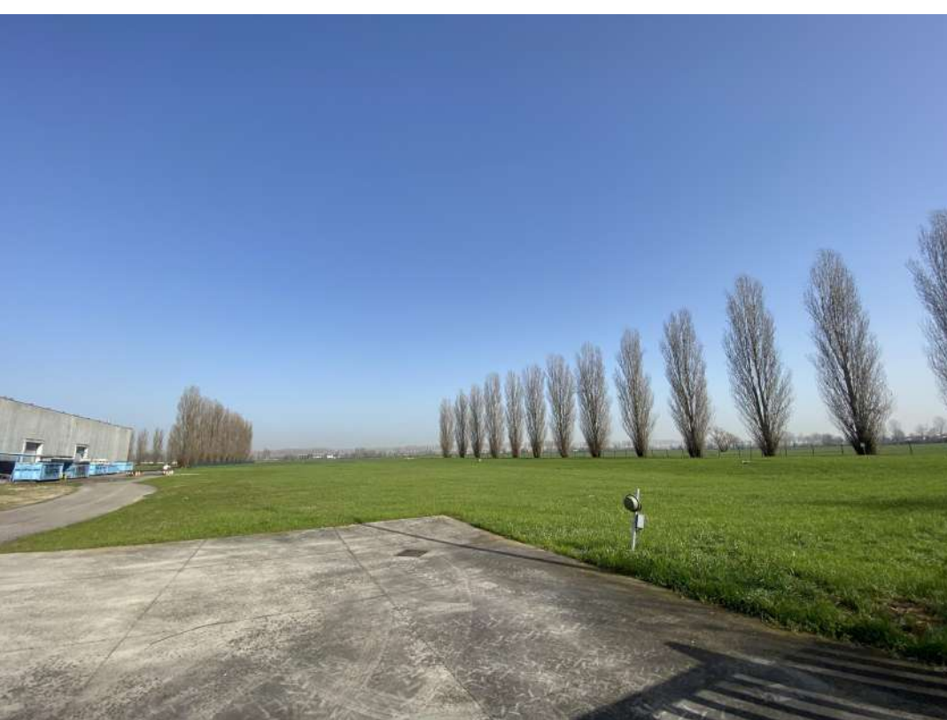
POSIZIONE DI SCATTO 24