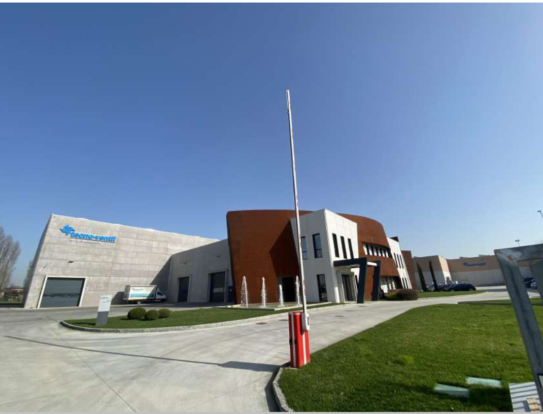
POSIZIONE DI SCATTO 13