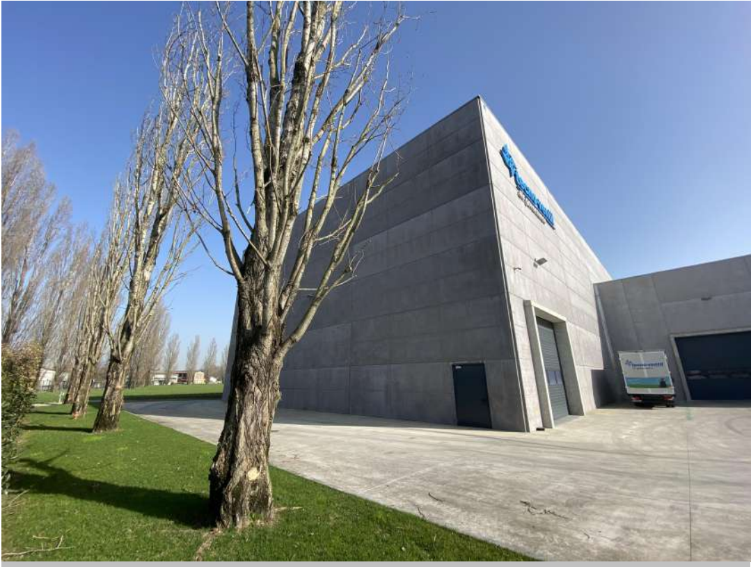
POSIZIONE DI SCATTO 9