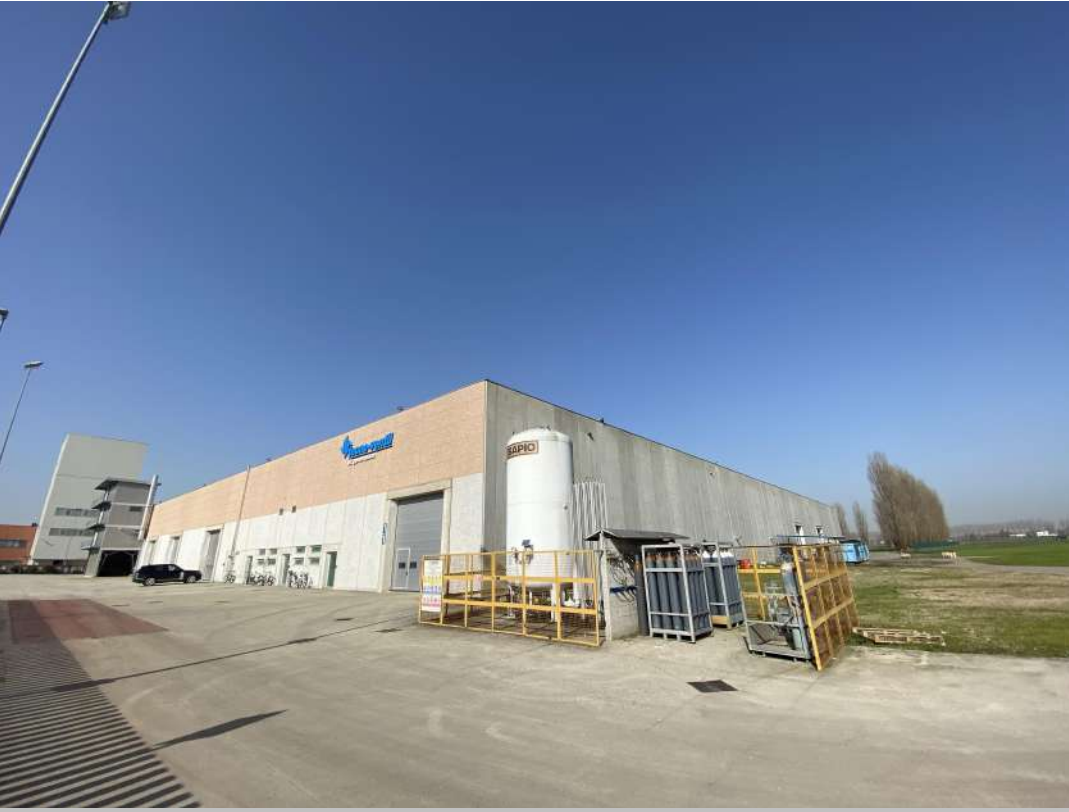
POSIZIONE DI SCATTO 22