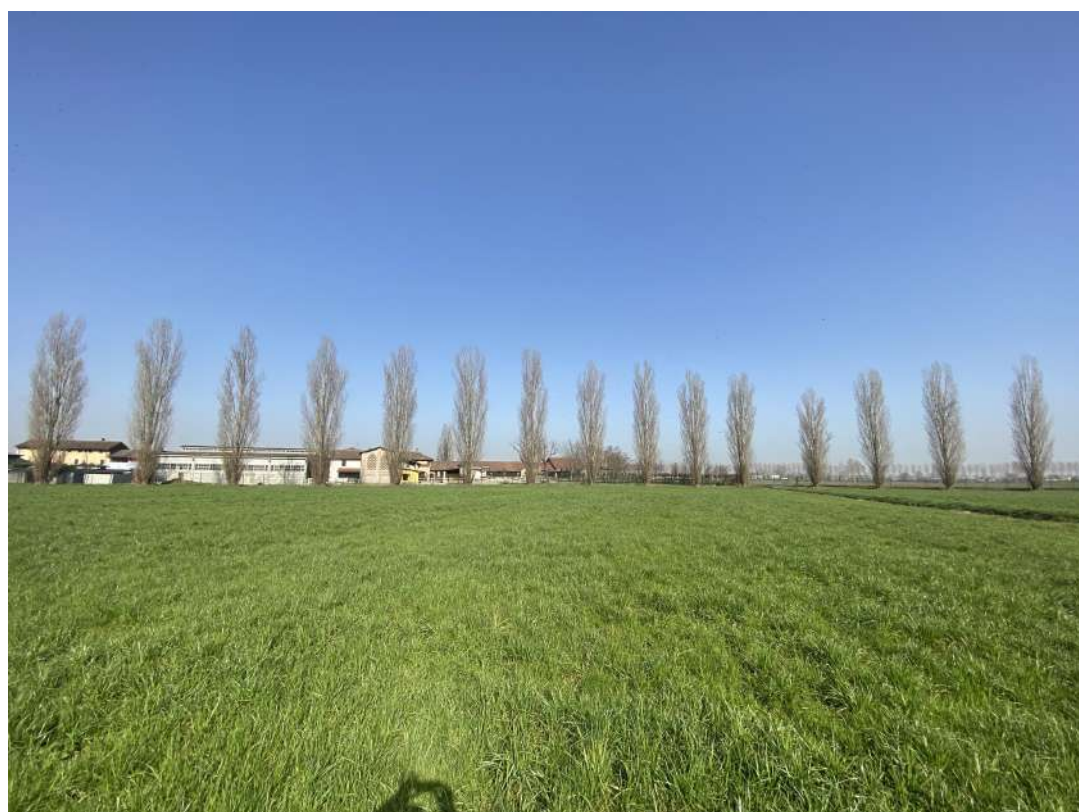
POSIZIONE DI SCATTO 5