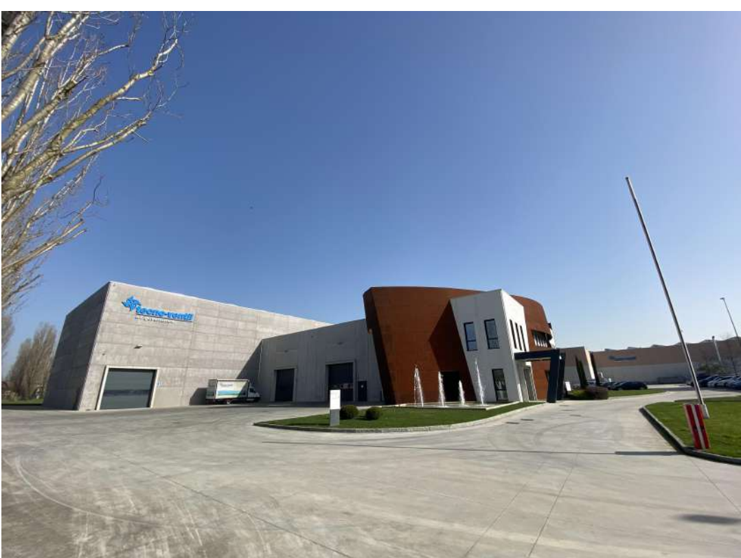
POSIZIONE DI SCATTO 12