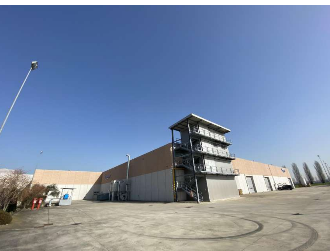
POSIZIONE DI SCATTO 18