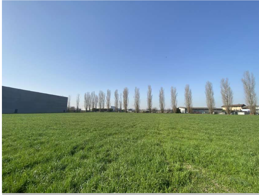
POSIZIONE DI SCATTO 3