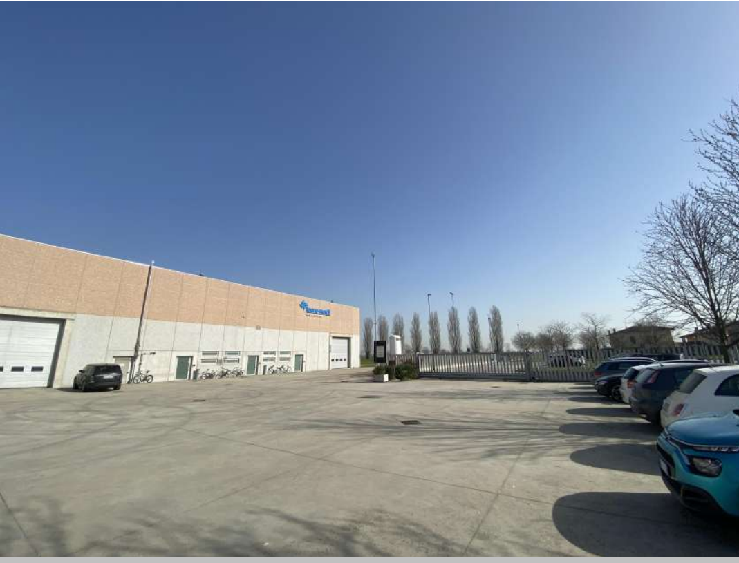
POSIZIONE DI SCATTO 21