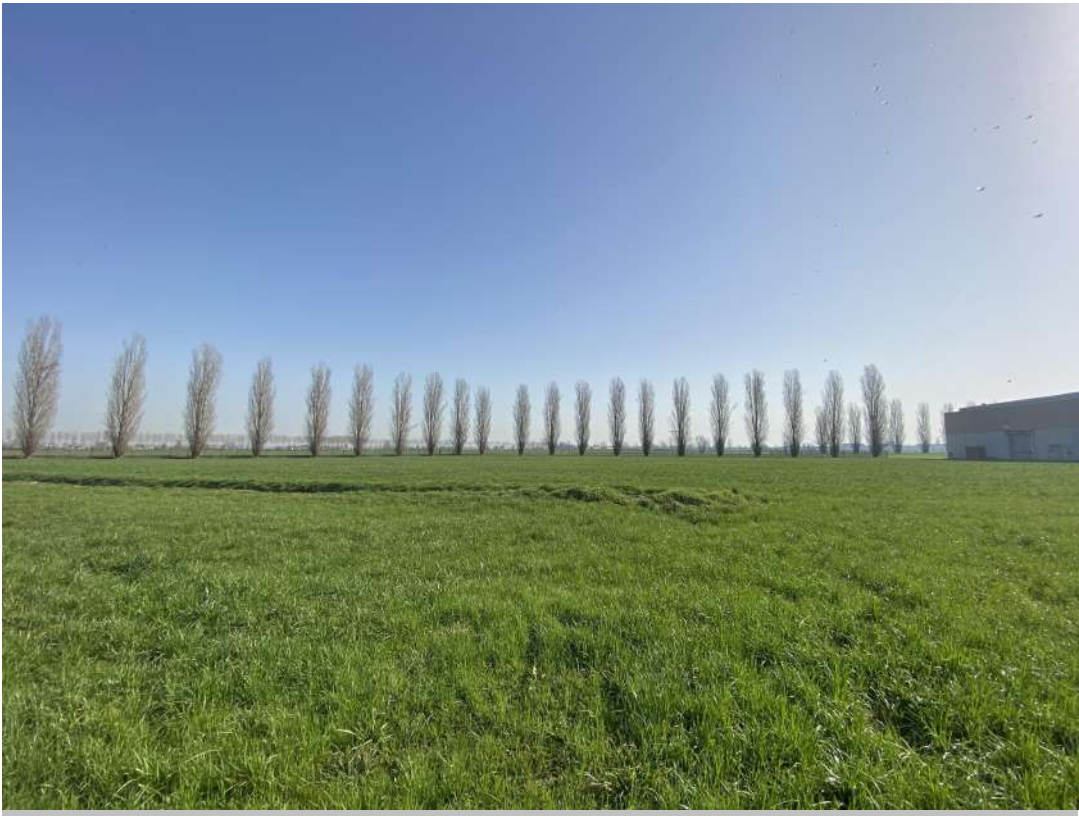
POSIZIONE DI SCATTO 8