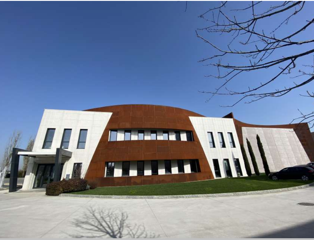
POSIZIONE DI SCATTO 14