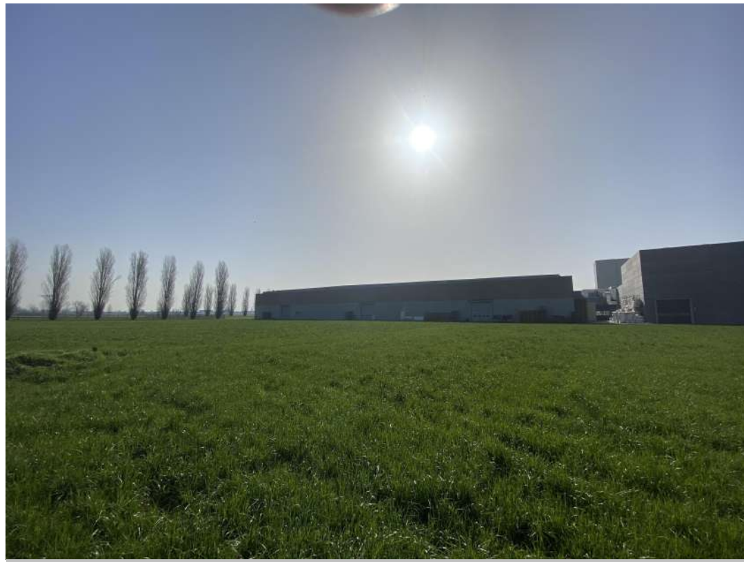
POSIZIONE DI SCATTO 1