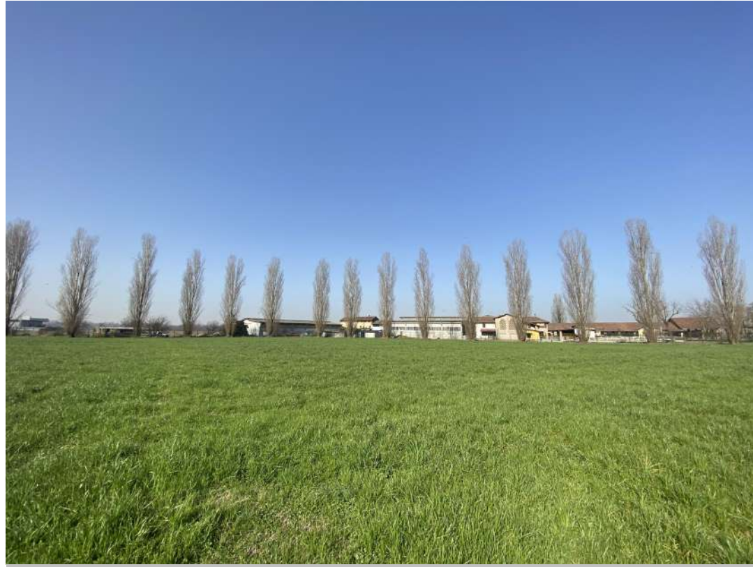
POSIZIONE DI SCATTO 4