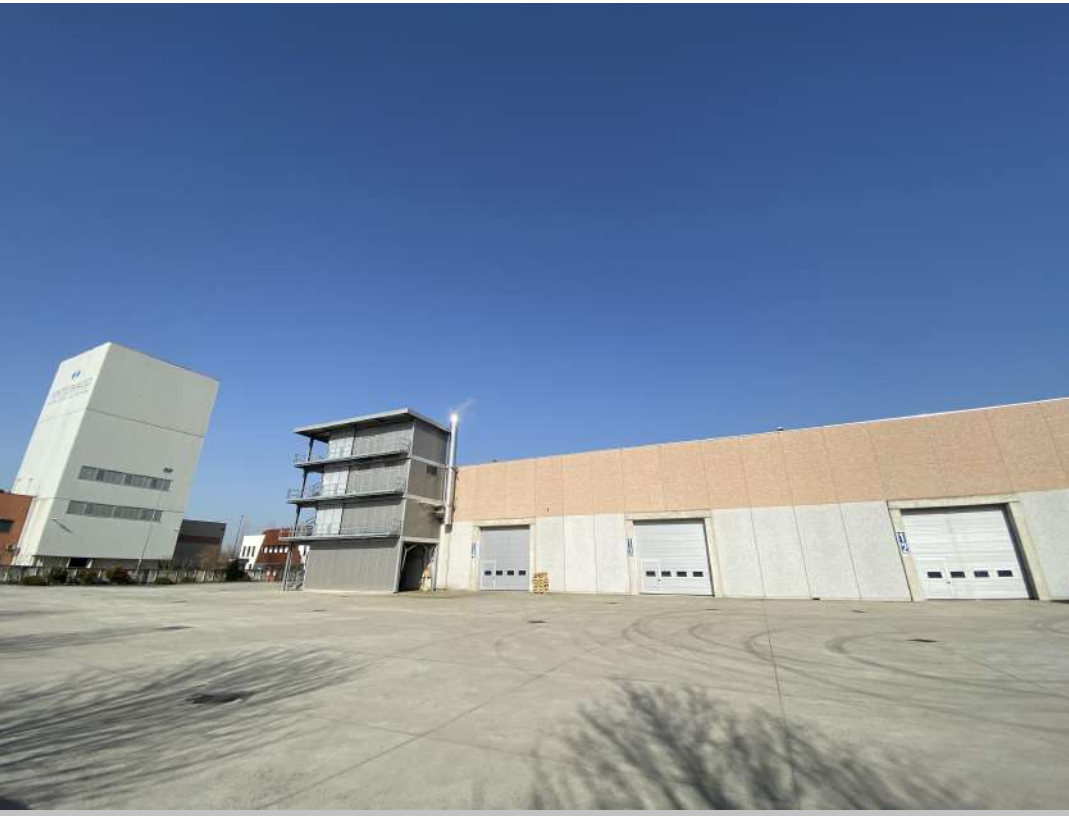
POSIZIONE DI SCATTO 20