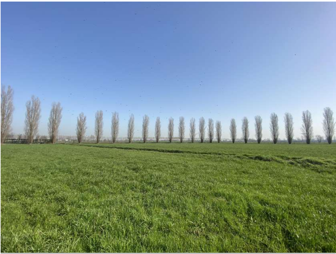
POSIZIONE DI SCATTO 7