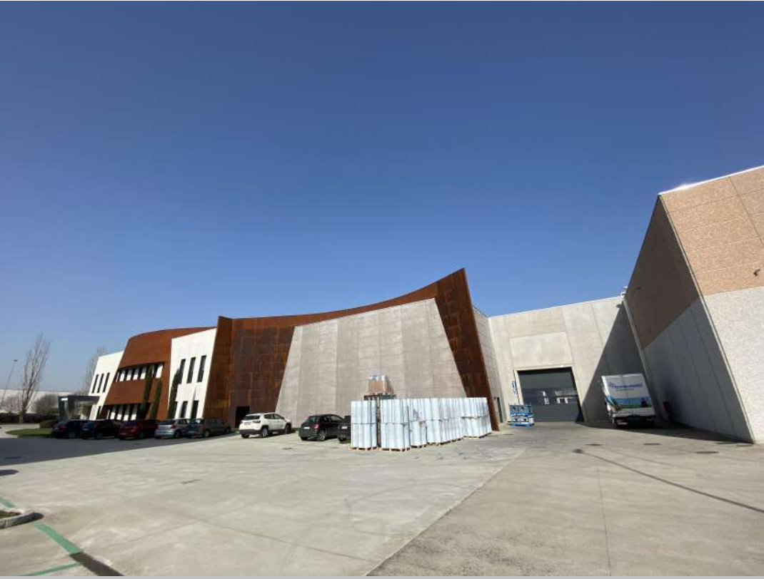
POSIZIONE DI SCATTO 16